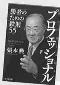
著者：張本 勲 発行：日之出出版 定価：1500円+税

経営 野球評論家、張本勲氏による初のビジネスパーソン向けの書籍。日本球界歴代1位の安打記録を保持するなど、まさに「一流街道」を歩みつづけてきた著者が、一流になるための方法を伝授する。 著者曰く「一流になれる素質は誰に