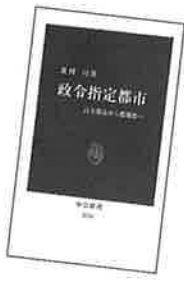
著者：北村 亘 発行：中央公論新社 定価：840円+税

時代の変化に対応した大都市統治制度の見直しを行っていくべきとの考えは首肯できるが、政令指定都市のなかには、道府県や市民との関係が良好に機能している都市も多いことも事実である。この統治制度を全否定するのではなく、「大都市中の大都市」にかぎった統治制度を真剣に考える時期にきていることを示唆しているのだ、と理解したい。